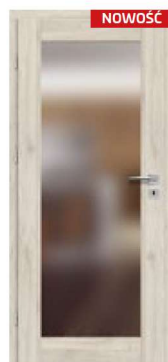
FREZJA 7 3)