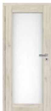
FREZJA 3 2)